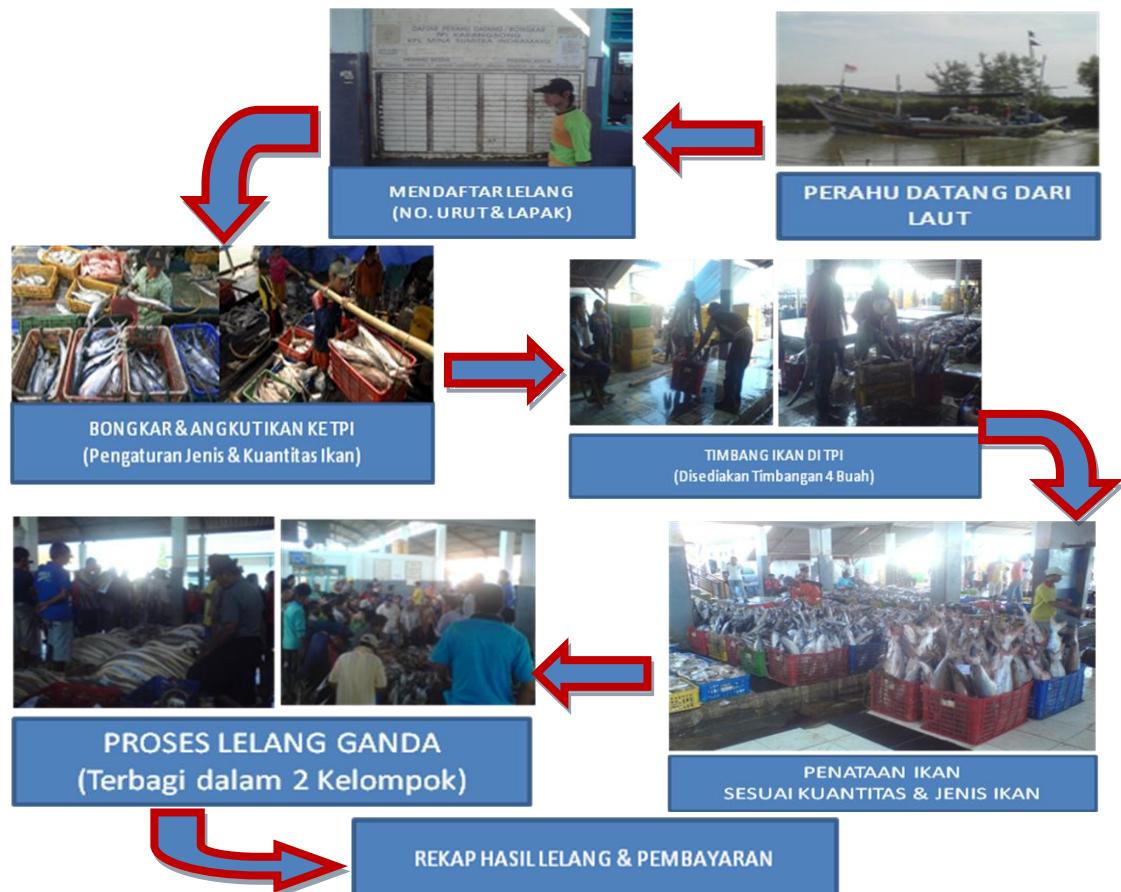
Gambar 3. Sistem Lelang Ikan Reengineering Process

Business process Reengineering Sistem Lelang Ikan pada TPI Karang Song yang penulis tawarkan sebagai solusi dalam pemecahan masalah adalah melalui analisis perhitungan di bawah ini :