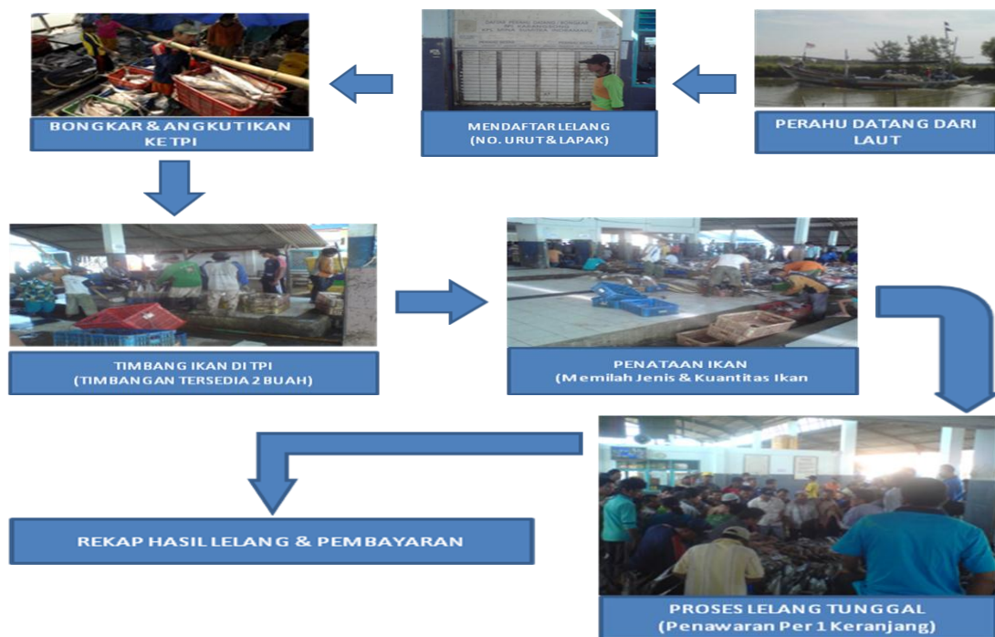
Gambar 2. Sistem Lelang Ikan TPI Karang Song Saat ini

Dengan pengelolaan sistem pelelangan tersebut, terdapat suatu masalah yang mungkin cukup mempengaruhi penambahan nilai omzet, yaitu dari banyaknya jumlah perahu (max 15 perahu/hari) yang akan melakukan bongkar hasil tangkapan, rata-rata satu perahu tidak dapat melakukan bongkar muatan ke dalam TPI dalam waktu satu hari (memerlukan waktu 2 – 3 hari untuk Perahu Uk \geq 20 GT), dimana hal ini sangat merugikan nelayan ataupun KPL itu sendiri, disebabkan nilai ikan akan semakin menurun pada lelang hari berikutnya (sekitar 10% - 20%) yang berakibat nilai omzet pun akan mengalami penurunan.